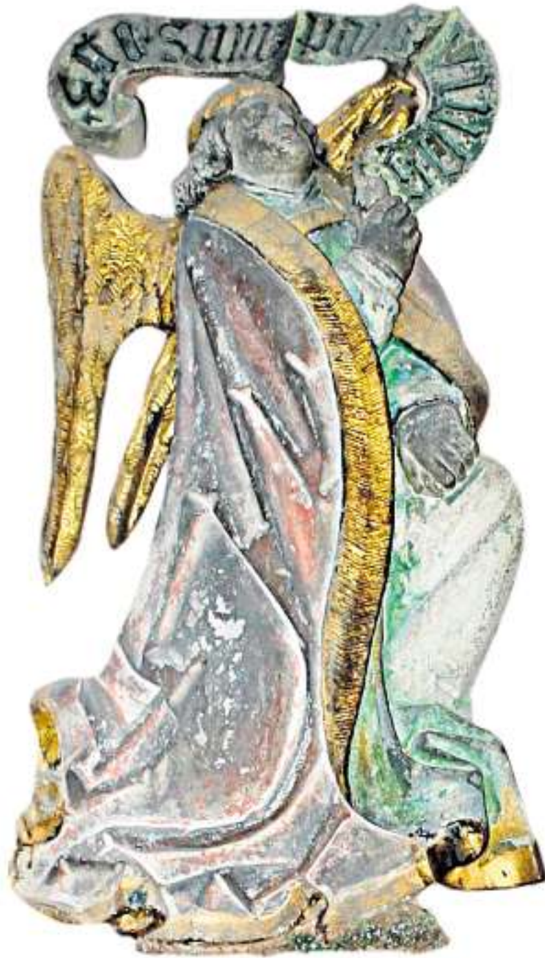
GUT BEWACHT: Figur am Sakramentschrein mit dem unheimlichen Relikt.

„Die Heinrichser Kirche ist früher sehr reich gewesen und besaß einen Reliquienschatz. In der Reformation wurden die Reliquien zwar üblicherweise entfernt. Aber wer weiß das heute schon so genau?“ Ebenso könnte die zarte Frauenhand freilich aus ganz anderen