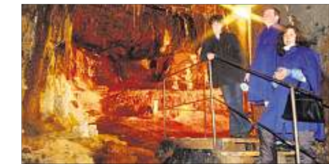
Knapp 11 000 Gäste kletterten im Vorjahr unter die Erde.

richten. Dazu organisierte er die erhellende Alaunschiefer-Förderung neu und rettete den bedrohten preußischen Kartoffelanbau, da aus Alaun und Vitriol Dünger und Schädlingsbekämpfungsmittel hergestellt wurden. Doch die unbenutzten Höhlen gerieten bis 1900 in Vergessen-