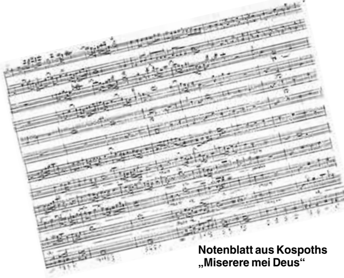
Notenblatt aus Kospoths „Miserere mei Deus“

Die Dinge nehmen eine verhängnisvolle Wendung, als Otto Carl Erdmann ins Vogtland zurückkehrt und beschließt, das in der großen weiten Welt gesehen in Mühltruff nachzuahmen. Er