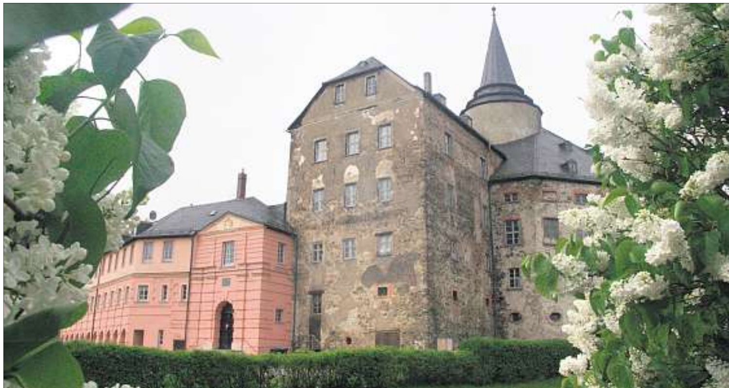
Schloss Mühltruff, das heute als Museum und für Veranstaltungen genutzt wird.